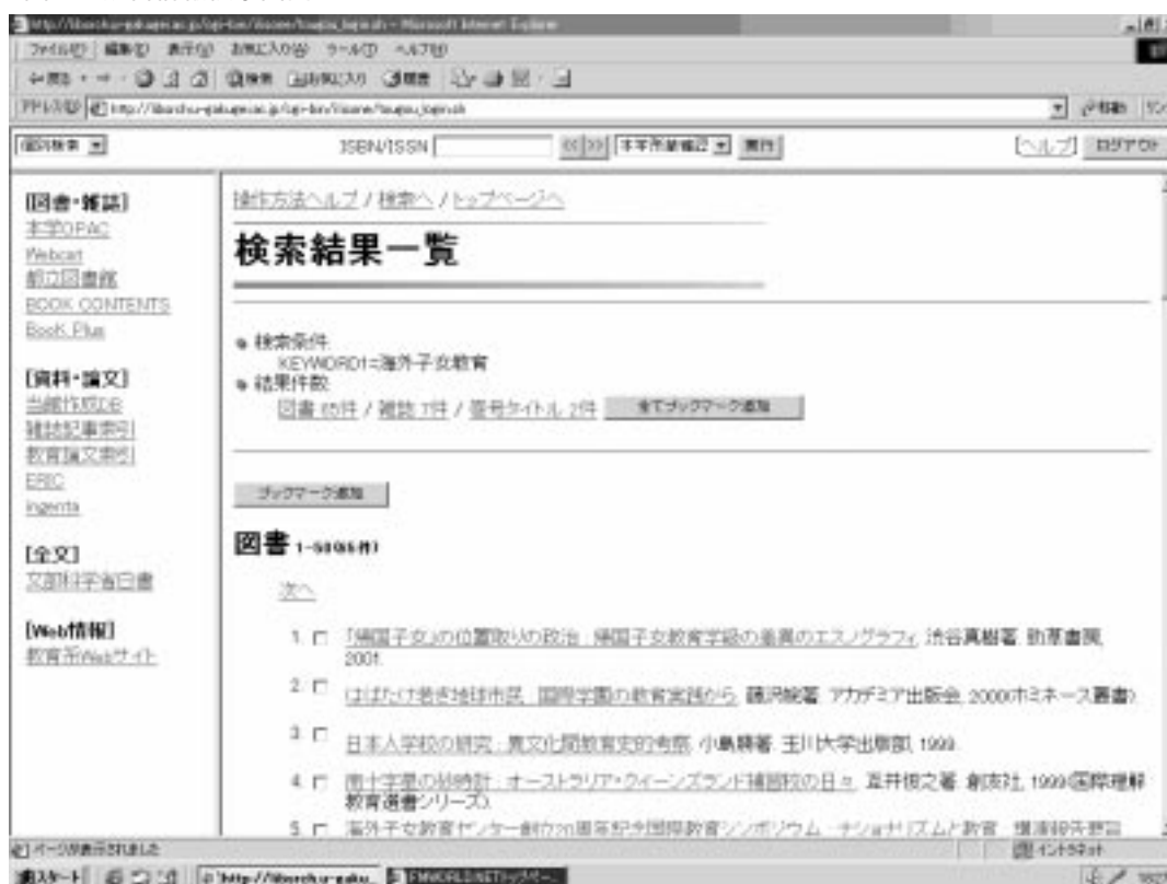
図2 統合情報検索画面